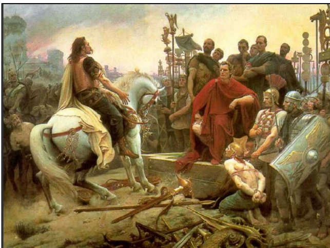
Vercingétorix jette ses armes aux pieds de César huile sur toile, de Lionel Royer, 1899

Pourquoi ? Comment ?). Les journalistes américains disent « 5W » (When, Where, Who, What, Why).