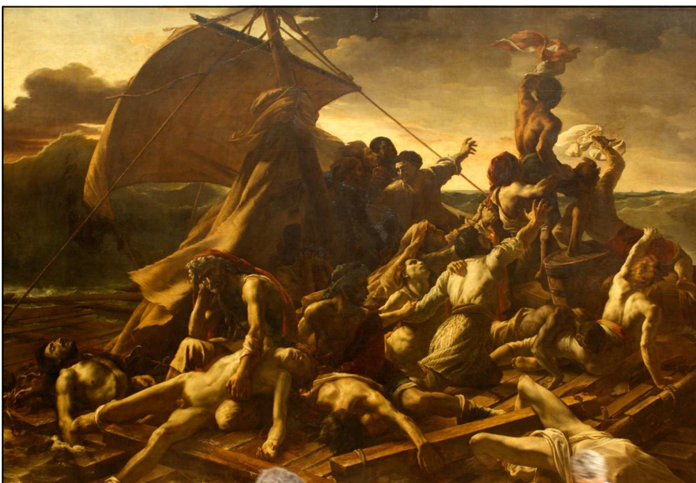
Le radeau de la méduse (GÉRICAULT, 1818-1819, huile sur toile, 491x716cm)

Pistes pour ton article : Où se passe cette scène ? Qui se bat contre qui ? Pour quelles raisons ? Et d'abord, c'est quoi, la « Bastille » ? Pourquoi des gens attaquent-ils la Bastille ? Que s'est-il passé ensuite ?...