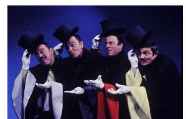
Les Frères Jacques