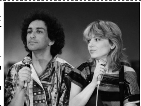
France Gall et Michel Berger (1979)