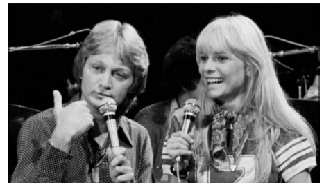
France Gall et Claude François (1964)

Car sans lui dans notre vie Il n'y'aurait que des jeudis Car sans lui dans notre vie Il n'y'aurait que des jeudis Oh ! Oh ! Sacré Charlemagne (6 fois)