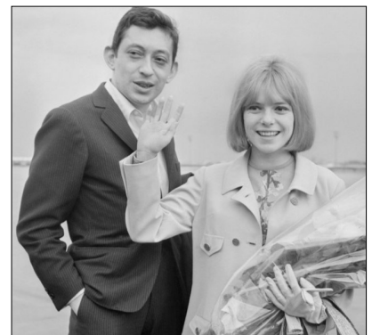
France Gall et Serge Gainsbourg (1965)